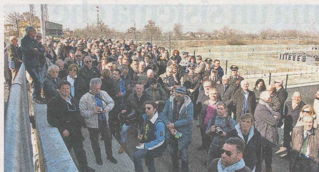
Grande partecipazione per la giornata storica: finalmente si inaugura l'attesa conca di navigazione