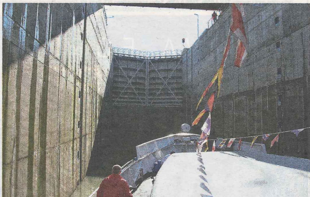
Una volta all'interno, la porta si è chiusa e nella vasca ha cominciato a fluire l'acqua