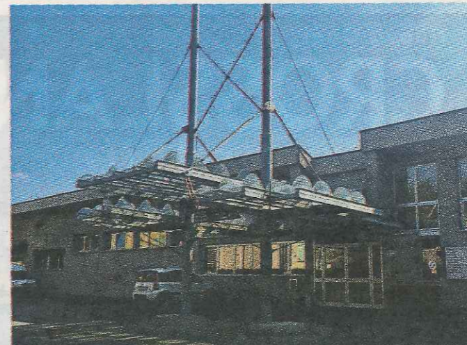
La casa protetta comunale di Cavriago

questa consiliatura. Non è stato un percorso facile, non fosse altro per l'ampio ricorso a contenziosi legali in tema di finanziamento delle opere pubbliche: penso ad esempio a tutte le cause che abbiamo dovuto sostenere per il recupero della fidejussione della scuola Rodari». Grassi ha annunciato poi che tra pochissimo sarà inaugurata la ristrutturazione degli ex Tigli e ha illustrato il piano che, per la parte entrate, prevede una cifra complessiva per il 2018 di 4.460.000, di cui fanno parte il «finanziamento per la Rodari, coperto in buona parte dalla fidejussione escussa, e il