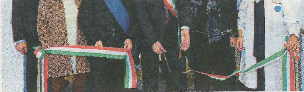
Le autorità presenti all'inaugurazione tagliano il nastro del nuovo corpo C dell'ospedale Franchini di Montecchio

SEI MILIONI DI EURO. Per la demolizione e la riqualificazione