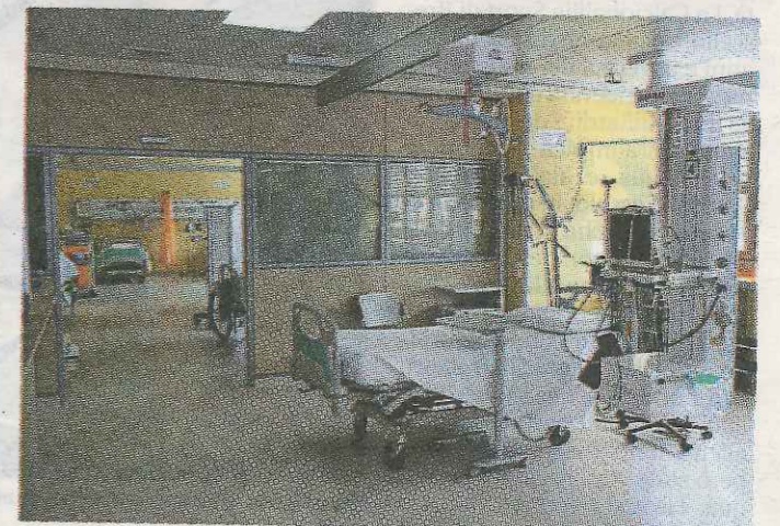
Uno dei nuovi locali del corpo C dell'ospedale Franchini di Montecchio

Bosi - interamente nuovo in classe energetica A+, con consumi molto ridimensionati e con una durata di vita molto più lunga». Con il Franchini, Sicrea conferma la specializzazione nel settore costruzioni healthcare, l'edilizia per la cura delle persone.