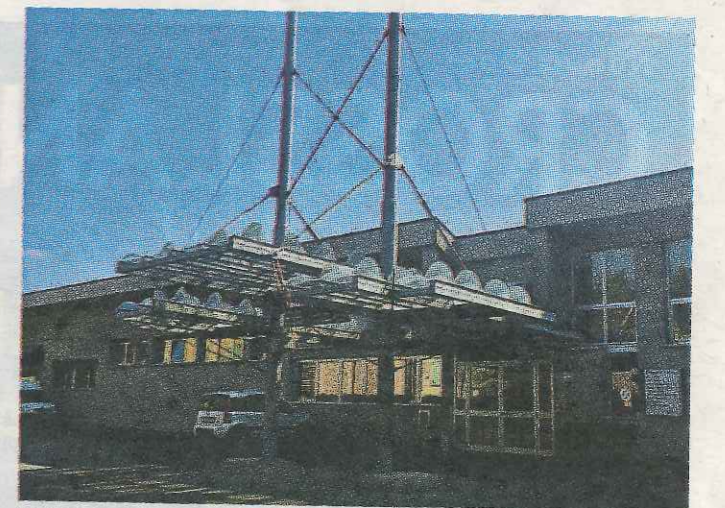
La casa protetta comunale di Cavriago